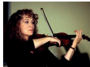
La Musique de mon cœur