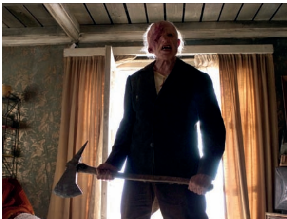
La colline a des yeux