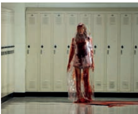
Les Griffes de la nuit