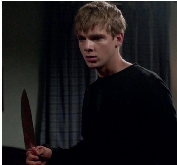
My Soul to Take

Film précédé de Paris, je t'aime : Père Lachaise de Wes Craven