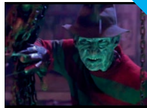
Le Cauchemar de Freddy