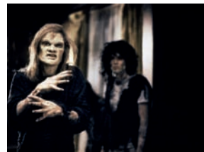
Le Sous-sol de la peur