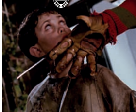
Freddy 5 : l'enfant du cauchemar