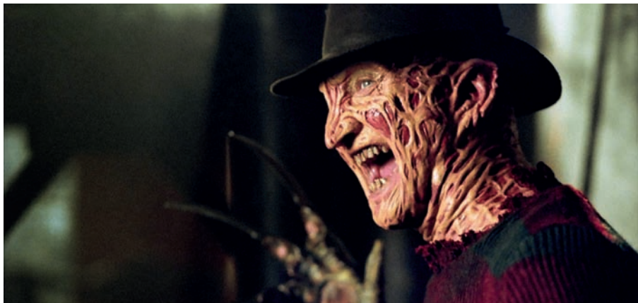
Les Griffes de la nuit