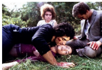
La Dernière Maison sur la gauche