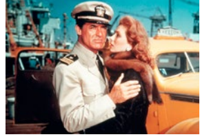
Embrasse-la pour moi