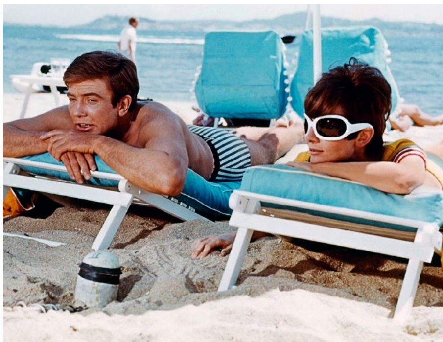
Voyage à deux

Comédie musicale ou pas, jusqu'au bout, Donen aura raconté cela : la grande aventure du corps, le sien, celui de ses acteurs, l'histoire de tous ses états, vitesse et ralentissement, mariage et divorce. Ce qu'il peut faire, ou pense ne plus pouvoir faire, ce qu'il peut réapprendre à faire pour croire encore au monde, réinvestir la joie dont le cinéaste fut le plus grand poète : se lever de son canapé, visiter une ville, faire un film, parler à une femme, reparler à sa femme ou, si tout cela paraît insurmontable, prendre simplement l'habitude d'oublier son parapluie. ●