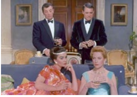
Ailleurs, l'herbe est plus verte