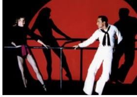
Un jour à New York