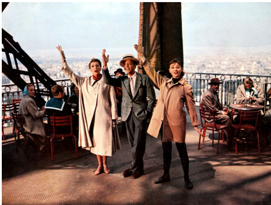
Drôle de frimousse

Les corps sont drogués à la joie, électrisés par la découverte d'une grande métropole, ce grand thème donénien : Paris ( Drôle de frimousse ), San Francisco