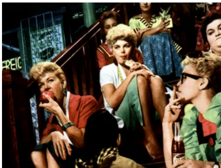
Pique-nique en pyjama

Les vitamines du musical ayant déserté ses films, Donen observe le corps d'acteurs mûrs (six titres avec un Cary Grant quinquagénaire), ralentis, pris dans la torpeur de la quotidienneté, du conformisme et de mariages polis. Ses personnages deviennent soudainement songeurs, intériorisés et bavards, observent leur vie pour mieux se demander « Que sommes-nous