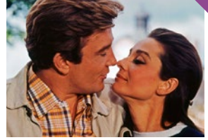
Voyage à deux