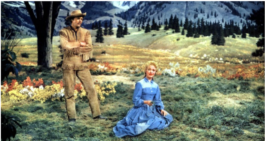
Les Sept Femmes de Barberousse