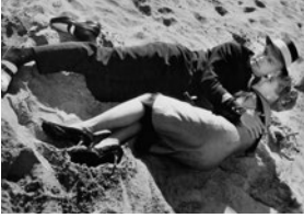
Un cadeau pour le patron