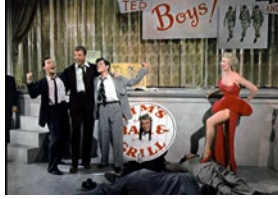
Beau fixe sur New York