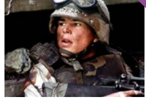
La Chute du faucon noir