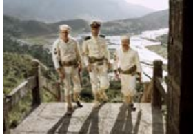
La Canonnière du Yang-Tsé