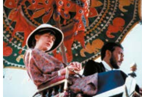
La Route des Indes