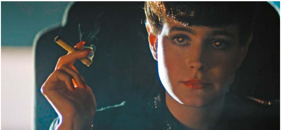
Blade Runner : Final Cut

DE SERGIO LEONE ÉTATS-UNIS-ITALIE/1982/227'/ VOSTF/35MM D'APRÈS LE ROMAN THE HOODS DE HARRY GREY. AVEC ROBERT DE NIRO, JAMES WOODS, ELIZABETH MCGOVERN. Noodles, un vieux gangster, revient à New York sur les lieux de son enfance. Les souvenirs de ses amis et de son premier amour lui reviennent en mémoire. sa 18 déc 19h45 [HL]