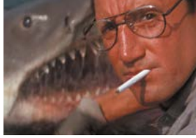
Les Dents de la mer