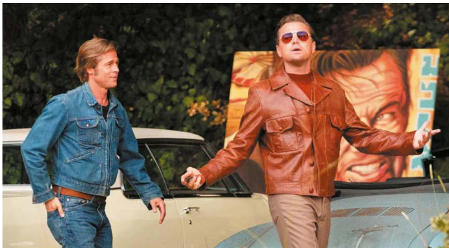
Once Upon a Time... in Hollywood

REMERCIEMENTS : CLASSIC FILMS, EUROZOOM, LES FILMS DU LOSANGE, METROPOLITAN FILM EXPORT, PARK CIRCUS, POTEMKINE, SONY PICTURES ENTERTAINMENT FRANCE, THE WALT DISNEY COMPANY FRANCE, UNIVERSAL PICTURES INTERNATIONAL FRANCE, WALT DISNEY COMPANY, WARNER BROS. PICTURES FRANCE.