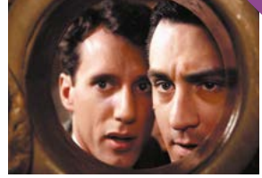
Il était une fois en Amérique