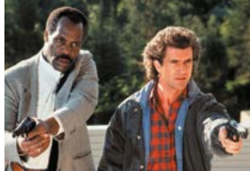
L'Arme fatale 2