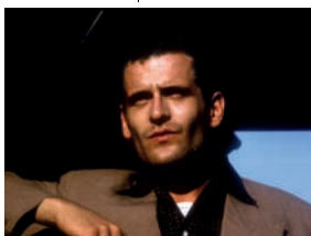
Mona et moi