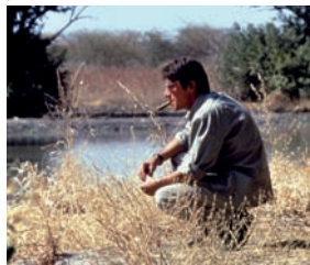
Le Maître des éléphants

REMERCIEMENTS : PATRICK GRANDPERRET, VIKTORIA VIDENNA, EMILIE GRANDPERRET, DAMIEN ODOUL, AGENCE DU COURT MÉTRAGE, BALTHAZAR PRODUCTIONS, GAUMONT, INA, PYRAMIDE DISTRIBUTION, TAMASA DISTRIBUTION, WILD BUNCH DISTRIBUTION.