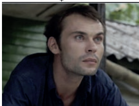
Fui banquero (J'étais banquier)