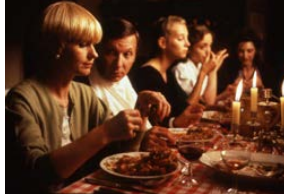
Milou en mai