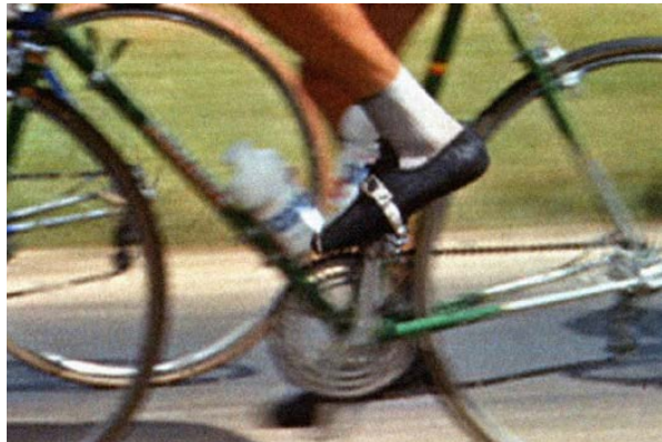
Vive le tour