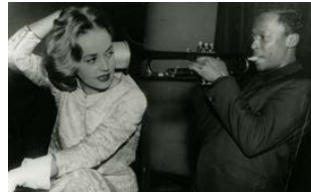
Ascenseur pour l'échafaud (séance d'enregistrement)