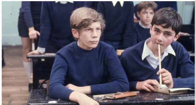
Le Souffle au cœur