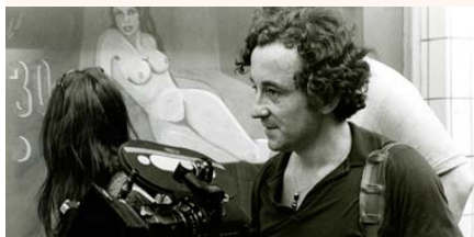
Louis Malle sur le tournage d' Au revoir les enfants

Tarifs séance : PT 6.5 €, TR 5.5 €, Libre Pass accès libre.