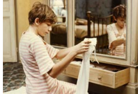
Le Souffle au cœur