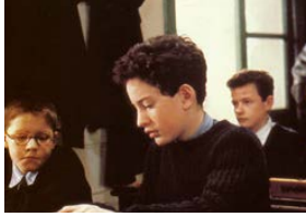
Au revoir les enfants