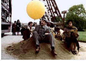
Zazie dans le métro