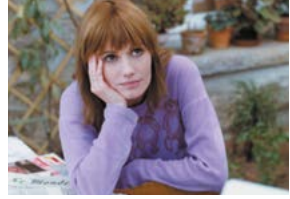
Les Routes du sud