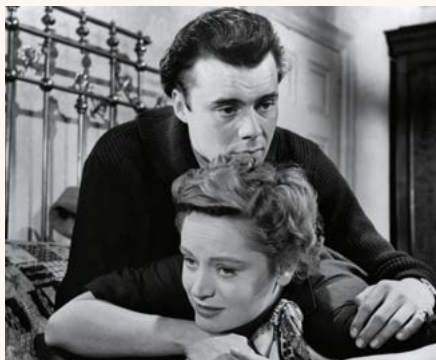
La bête s'éveille