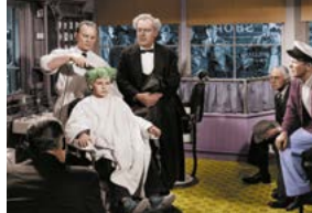
Le Garçon aux cheveux verts