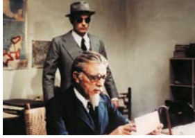
L'Assassinat de Trotsky