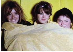
Du côté d'Orouet