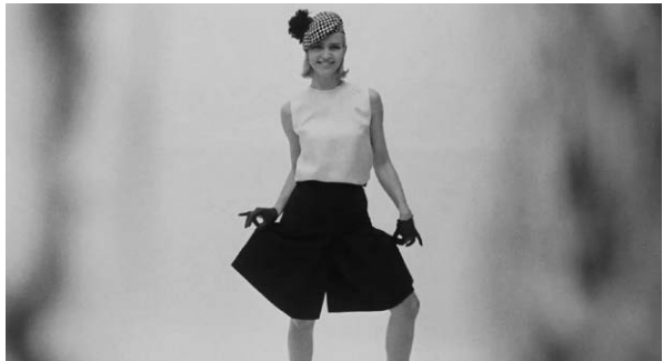
Dans le vent