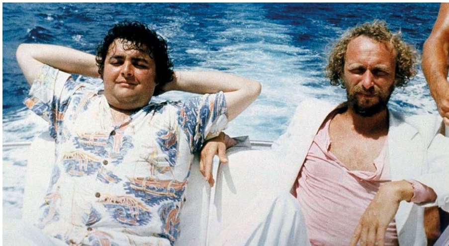
Les Naufragés de l'île de la Tortue

Pas de sens de la hiérarchie chez Rozier ! Ce bouillonnement en est bien la preuve. De fait, le futile et le superficiel prennent une autre gravité. Rien de plus essentiel que le temps des vacances. La virée au Club Med avant la convocation pour la guerre d'Algérie ( Adieu Philippine ),