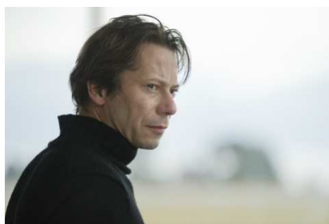
L'Amour est un crime parfait (2013)

FRANCE-BELGIQUE/2013/110'/DCP D'APRÈS INCIDENCES DE PHILIPPE DJIAN AVEC MATHIEU AMALRIC, KARIN VIARD, MAÏWENN, SARA FORESTIER. Marc, professeur de littérature à l'université de Lausanne, collectionne les conquêtes parmi ses étudiantes. Un matin, il se réveille avec l'une d'entre elles morte dans son lit. sa 19 sep 21h30 je 15 oct 19h00