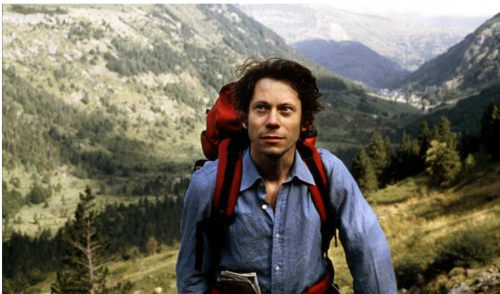
La Brèche de Roland (1999)