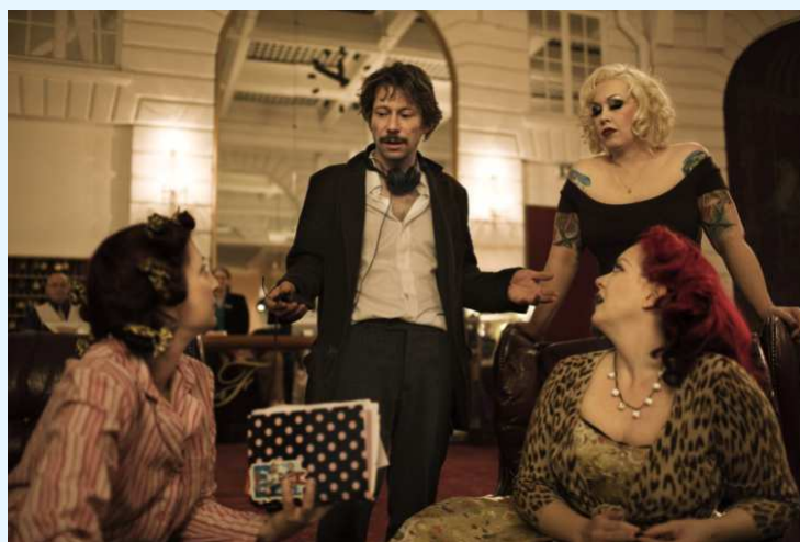
Sur le tournage de Tournée (2009)

Tarifs séance : PT 6.5 €, TR 5.5 €, Libre Pass accès libre.