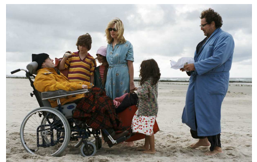
Le Scaphandre et le Papillon (2006)