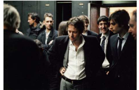
La Question Humaine (2006)