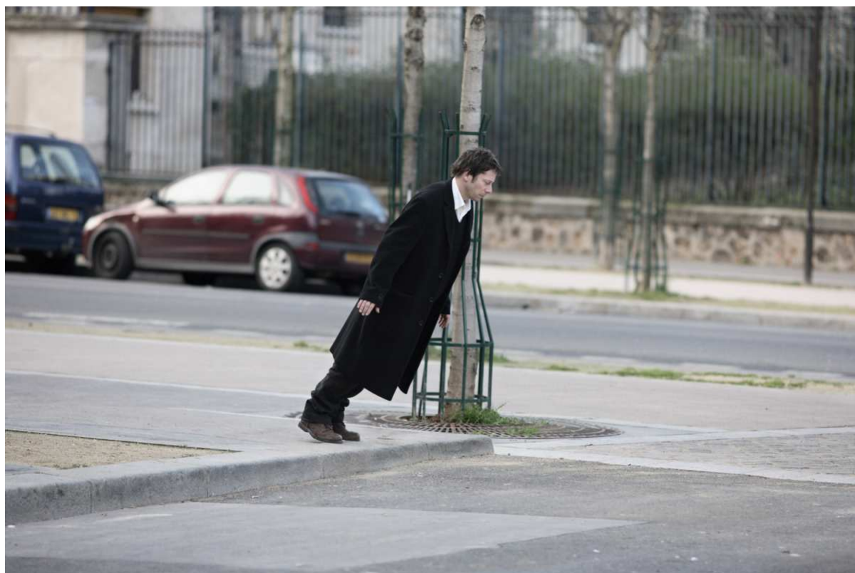
Un conte de Noël (2007)

je vous en prie ! ». Dans Rois et reine , interné contre son gré, il se lance pendant une séance de groupe dans une break dance de son invention, irrésistiblement drôle et fatalement séduisante. Mathieu Amalric est un saltimbanque débordant d'énergie, de malice, de violence que seul le cadre, celui des autres comme le sien, contient. Mathieu Amalric est un réalisateur qui tourne comme Truffaut chacun de ses films contre le précédent et, comme Truffaut, qui filme seulement ce qu'il aime, celle qu'il aime. Du Stade de Wimbledon à La Chambre bleue , il manifeste ce désir de l'autre et de sa lumière et, en même temps, conserve déjà sur pellicule une trace de la finitude toujours possible des grandes passions. À sa façon, Paul Dédalus le disait déjà : « Je ne peux pas sortir avec une fille si je ne sais pas comment ça se termine. Les histoires entre les gens, c'est fait pour se terminer, ça se termine toujours. Ce n'est pas de ma faute, c'est universel. » (Comment je me suis disputé...). Mathieu Amalric court après le temps pour le retenir, au moins le retarder. En attendant, il le marque.