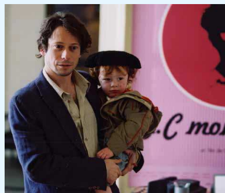
Un homme, un vrai (2002)

sa 19 sep 17h30 (suivi d'un dialogue, voir p.12)