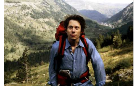
La Brèche de Roland (1999)

Film suivi de Les Parallèles de Nicolas Saada et de Un lever de rideau de François Ozon