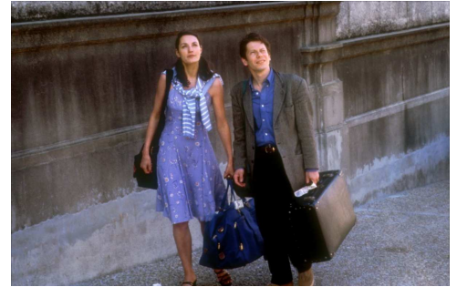
Trois Ponts sur la Rivière (2006)