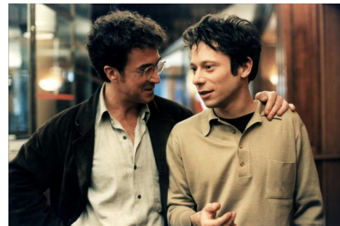
Fin août, début septembre (1998)