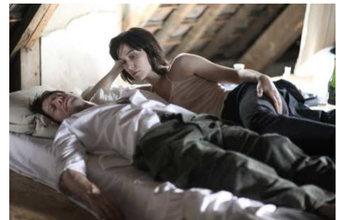
De la guerre (2007)