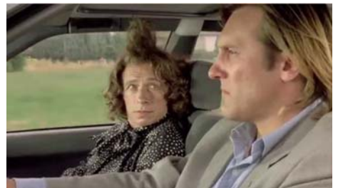
Les Fugitifs , Francis Veber, 1986, © Gaumont