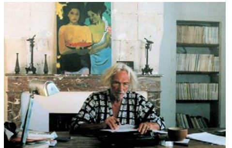
En attendant le déluge, Damien Odoul, 2003, © DR