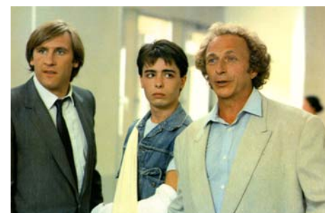
Les Compères, Francis Veber, 1983

Séance présentée par Pierre Richard (sous réserve)