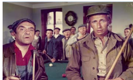
Alexandre le bienheureux , Yves Robert, 1967, © Gaumont