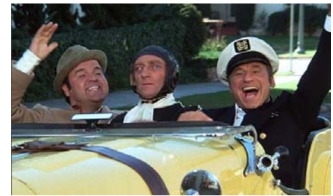
La Dernière folie de Mel Brooks, Mel Brooks, 1975