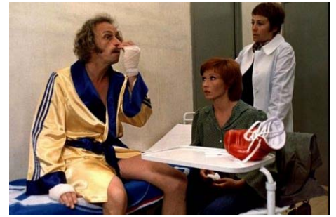
Juliette et Juliette , Remo Forlani, 1973, © DR

Film précédé de L'Espace d'un instant de Alexandre Athané