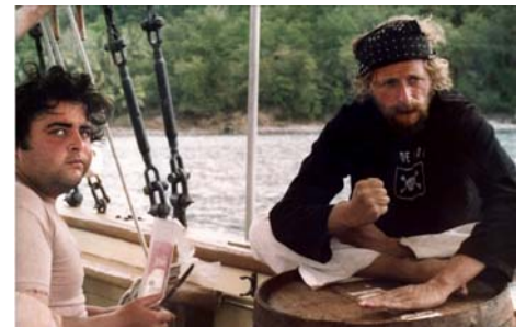
Les Naufragés de l'île de la tortue , Jacques Rozier, 1974