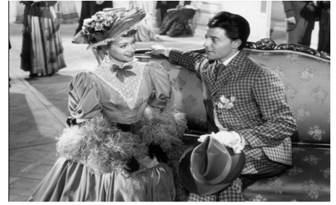
Les Belles de nuit , René Clair, 1952, © DR