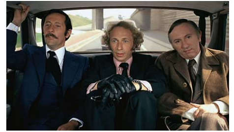
Le Retour du grand blond , Yves Robert, 1974, © Gaumont