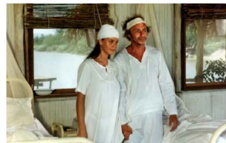
La Chèvre, Francis Veber, 1981