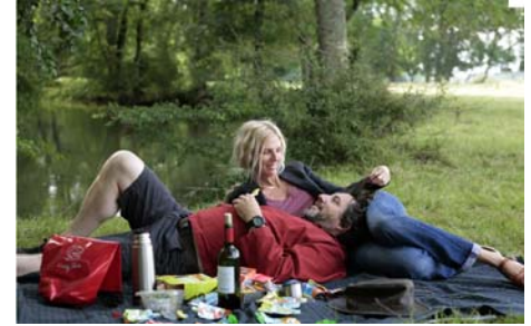
Comme un avion , Bruno Podalydès, 2014

Séance présentée par Bruno Podalydès et Pierre Richard (sous réserve)