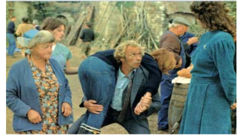
Un chien dans un jeu de quilles , Bernard Guillou, 1982