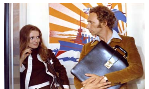
Le Distrait , Pierre Richard 1970