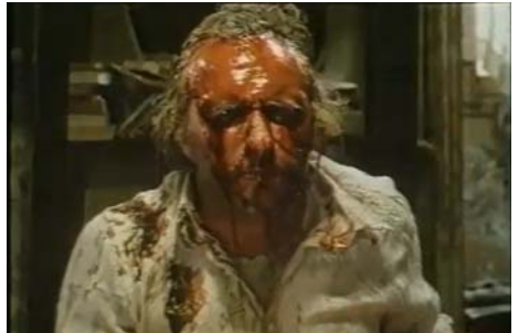
Dialogue de sourds, Bernard Nauer, 1984, © DR

Film suivi de Et si on vivait tous ensemble ? de Stéphane Robelin