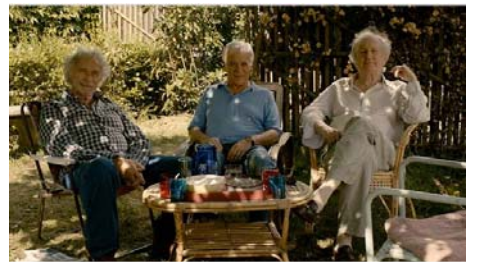
Et si on vivait tous ensemble , Stéphane Robelin, 2010

Film précédé de Dialogue de sourds de Bernard Nauer