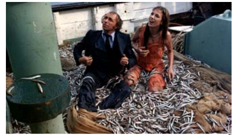
La course à l'échalote, Claude Zidi 1975