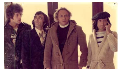
Je sais rien, mais je dirai tout, Pierre Richard, 1973