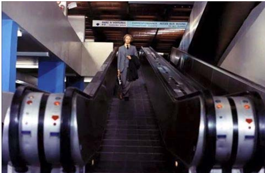
Le Grand Blond avec une chaussure noire de Yves Robert, 1972

Personnage lunaire et poétique dans les années 1970 ( Le Distrait... ), Pierre Richard devient ensuite le héros désarticulé de comédies populaires chez Claude Zidi ( La moutarde me monte au nez ) ou Gérard Oury ( La Carapate ), avant de constituer, avec Gérard Depardieu, le duo de la trilogie à succès de Francis Veber ( La Chèvre , Les Compères , Les Fugitifs ). Tout au long de sa carrière, il n'hésitera pas à prendre le risque de films d'auteur, incarnant des personnages plus inattendus ( Les Naufragés de l'île de la Tortue ou En attendant le déluge ).