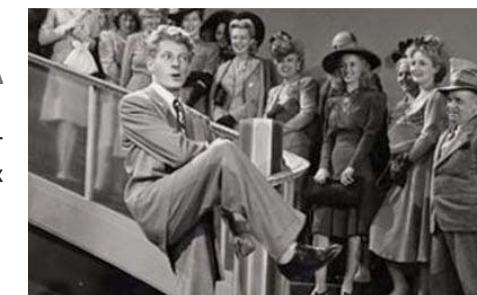
Up in arms , Elliot nugent, 1944