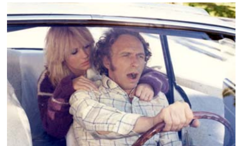
On aura tout vu , Georges Lautner, 1976