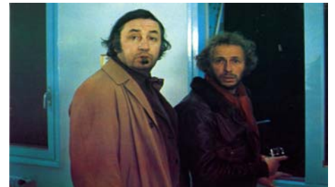
Un Nuage entre les dents , Marco Pico, 1973, © DR