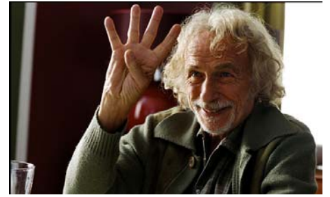
Essaye-moi, Pierre-François Martin-Laval, 2005