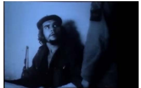
Parlez-moi du Che , pierre Richard, 1987