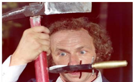
Le Jouet , Francis Veber, 1976

Film précédé du Petit Blond avec un mouton blanc d'Éloi Henriod.