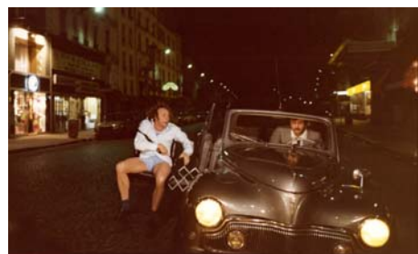
La Carapate , Gérard Oury, 1978, © Gaumont