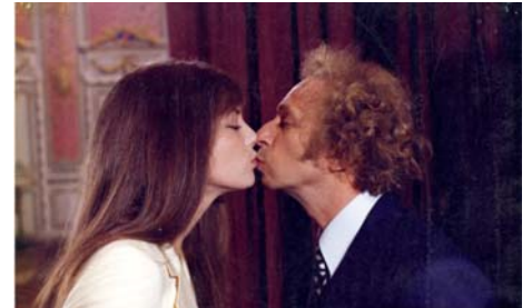
La moutarde me monte au nez , Claude Zidi, 1974, © Tamasa Distribution