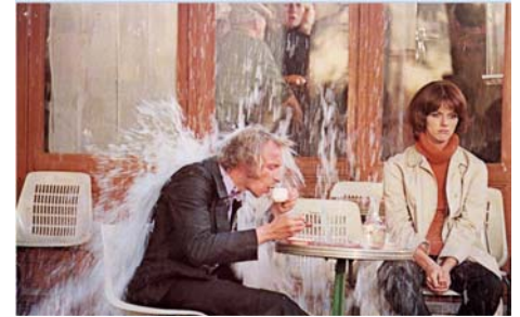
Les Malheurs d'Alfred , Pierre Richard 1977, © Gaumont