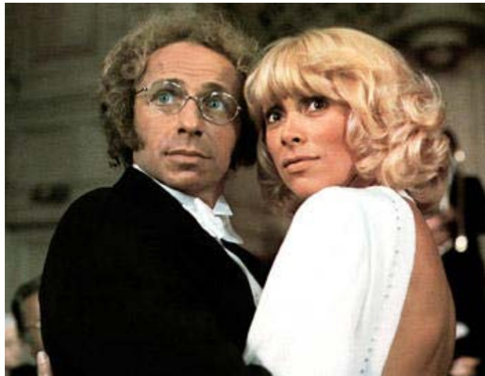
Le Retour du grand blond, Yves Robert, 1974