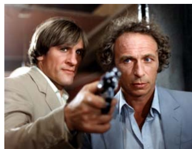
La Chèvre de Francis Veber, 1981