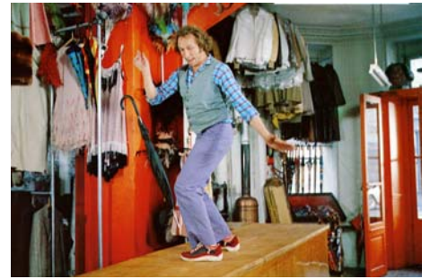
Le Coup du parapluie, Gérard Oury, 1980, © Gaumont