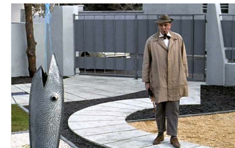
Mon Oncle, Jacques Tati, 1957