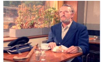
Un Marin solitaire, Annett Wolf, 1971 © DR.