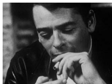
Le Monde de Jacques Brel, Annett Wolf, 1972