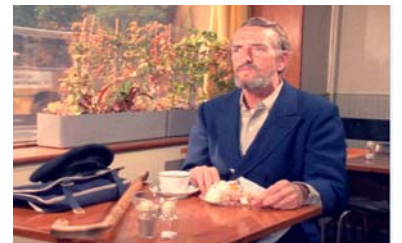
Un Marin solitaire, Annett Wolf, 1971