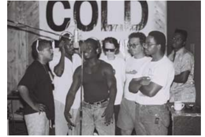
Crossfire , Annett Wolf, 1988 © DR.