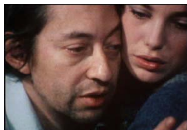
Le Temps de vivre, Annett Wolf, 1974 © DR.