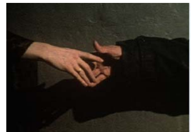
Danmarks Schade , Annett Wolf, 1972