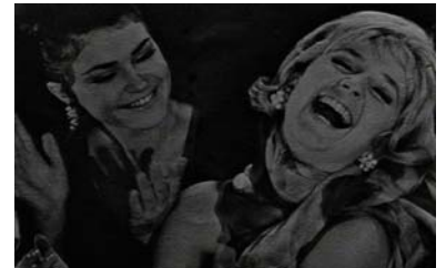
La Fille aux ballerines, Annett Wolf, 1965 © DR.