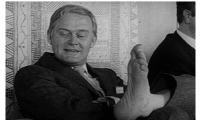
L'homme qui avait perdu sa chaussure,