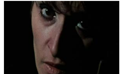
Le Monde de Barbara , Annett Wolf, 1972