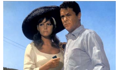
Comment réussir en amour sans se fatiguer, Alexander Mackendrick, 1966

AVEC TONY CURTIS, CLAUDIA CARDINALE, ROBERT WEBBER, JOANNA BARNES. À peine arrivé en Californie, Carlo Cofield perd tout ce qu'il possède dans l'incendie de sa voiture, accrochée par une jeune artiste, Laura. L'amant de celle-ci, Prescott, désireux de ne pas ébruiter sa liaison, rechigne à indemniser Carlo qui décide alors de tirer parti de la situation. di 21 fév 19h00 / di 28 fév 14h30