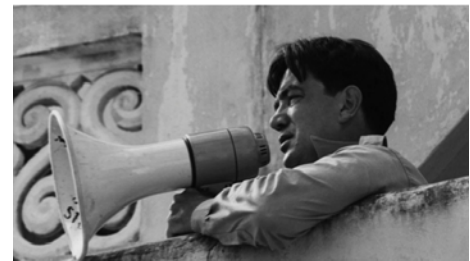
Mackendrick : The man who walked away , Dermot McQuarrie, 1986