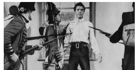
Au Fil de l'épée , Guy Hamilton, 1959