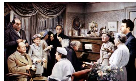
Tueurs de dames, Alexander Mackendrick, 1955 © Tamasa Distribution.