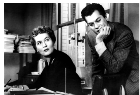
Le Grand chantage, Alexander Mackendrick, 1957 © Flash Pictures.