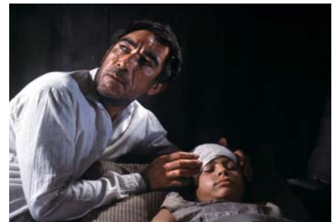
Cyclone à la jamaïque, Alexander Mackendrick, 1964

lu 15 fév 20h00 Ouverture de la rétrospective sa 27 fév 21h15