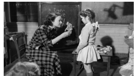
La Merveilleuse histoire de Mandy, Alexander Mackendrick, 1952 © Tamasa Distribution.