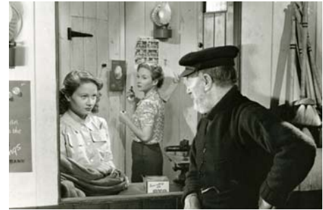
Whisky à gogo , Alexander Mackendrick, 1949

Film précédé de Kitchen Waste for Pigs / Save Your Bacon de Alexander Mackendrick et Roger MacDougall