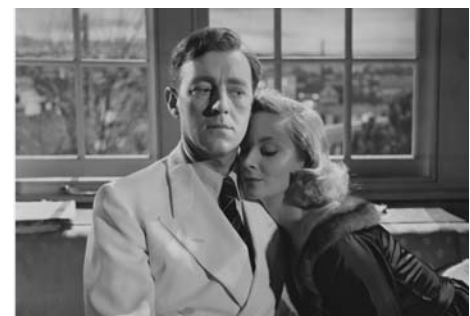
L'Homme au complet blanc, Alexander Mackendrick, 1950

Film précédé de Contraries de Alexander Mackendrick