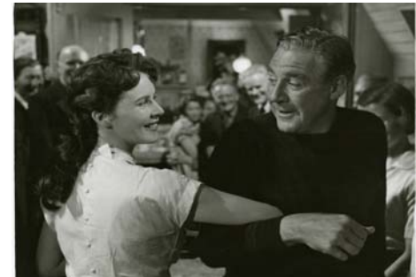
Maggie, Alexander Mackendrick, 1953