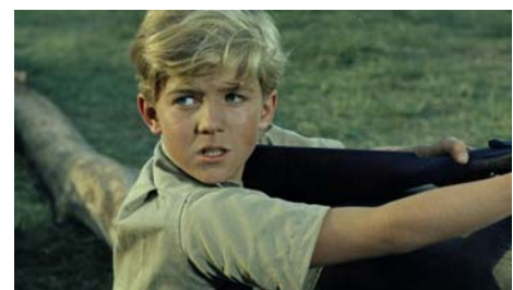
[L'Odyssée du petit Sammy], Alexander Mackendrick, 1962