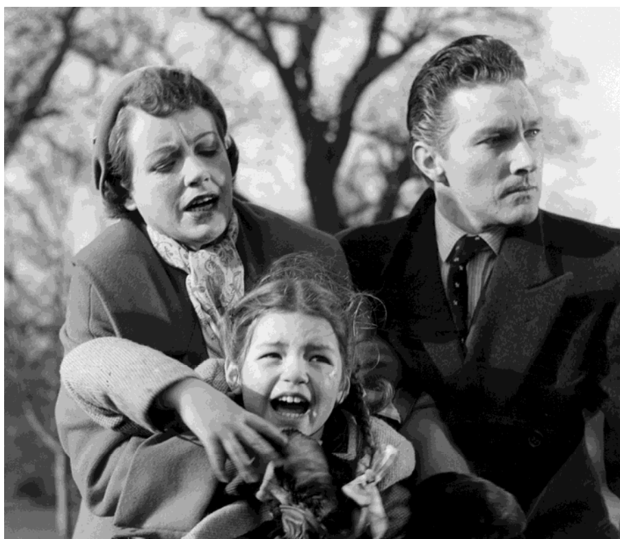
Maggie de Alexander Mackendrick (1953)

L'un des cinéastes anglais les plus américains. Sa filmographie est d'une remarquable singularité ( Tueurs de dames , Le Grand chantage , Whisky à gogo , Cyclone à la jamaïque ).