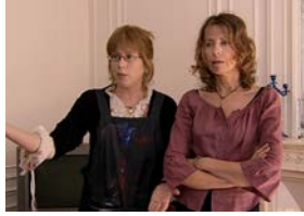
Le Canapé rouge