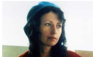
Le Rayon vert