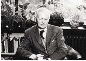
Cinéastes de notre temps : Carl Th. Dreyer