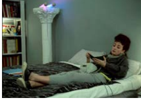
Les Nuits de la pleine lune