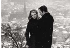
Ma nuit chez Maud