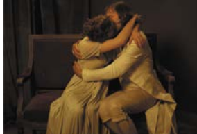
La Marquise d'O...