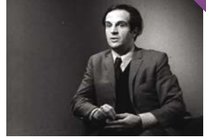
Postface à L'Atalante