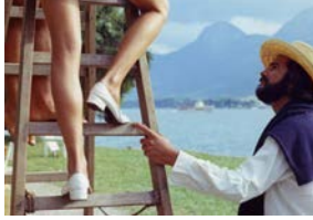
Le Genou de Claire