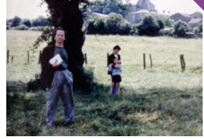
L'Arbre, le Maire et la Médiathèque