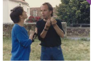
L'Arbre, le Maire et la Médiathèque.