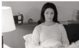
Ma nuit chez Maud

Profondément ancrés dans les années 1990 bien que l'on devine l'influence capitale de La Bruyère, les « Contes des quatre saisons » (1990-1998 : Conte de printemps , Conte d'hiver , Conte d'été , Conte d'automne ) préservent le charme suranné et inimitable des dialogues du cinéma d'Éric Rohmer, qui défend encore