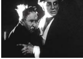
Les Histoires extraordinaires d'Edgar Poe