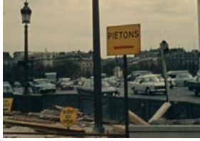
Paris vu par...