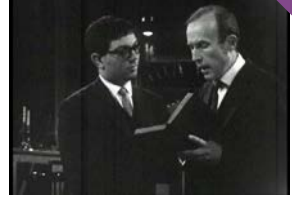
Les Cabinets de physique au XVIIIème siècle