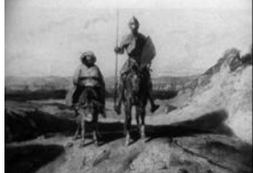
Don Quichotte de Cervantès