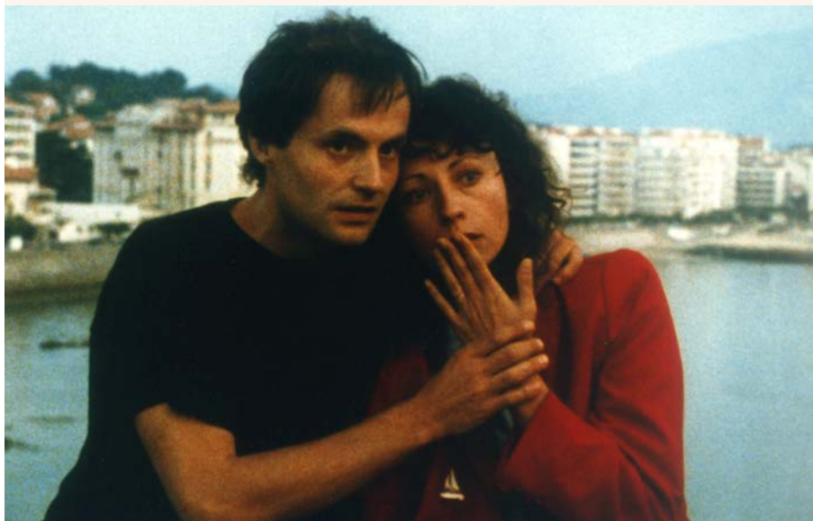
Le Rayon vert

Tarifs séance : PT 7€, TR 5.5€, Libre Pass accès libre.