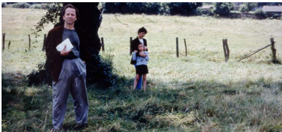
L'Arbre, le Maire et la Médiathèque