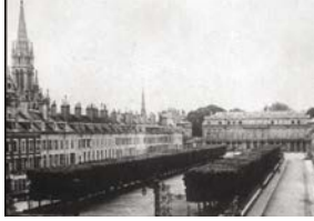
Nancy au XVIII ème siècle