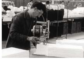
L'Homme et la machine