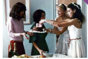
Le Beau mariage