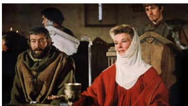
Un lion en hiver