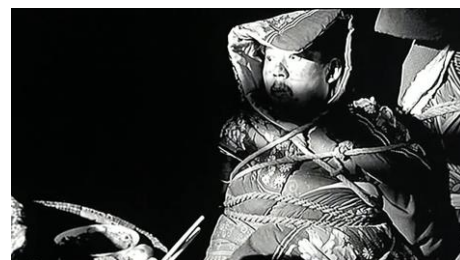
Les Démons à ma porte , Jiang Wen, 2000