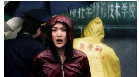
La Rivière Suzhou . Lou Ye 2000