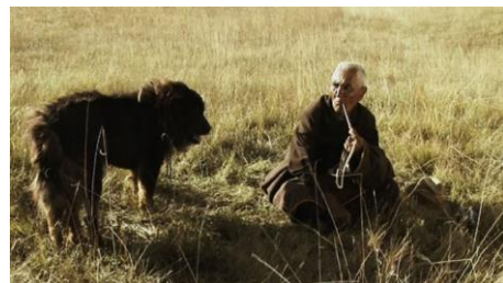
Le Vieux chien , Pema Tsenden, 2011