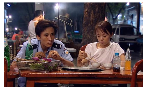
Uniform , Diao Yi'Nan, 2003

Film précédé de The Questioning de Zhu Rikun