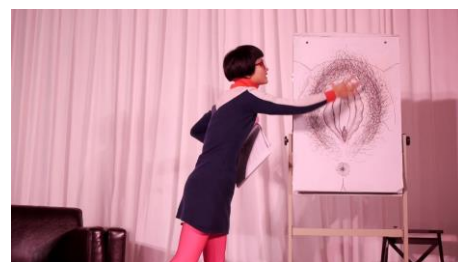
The Vachina monologues , Fan Popo, 2014

Film suivi de Withered in a Blooming Season de Cui Zi'en