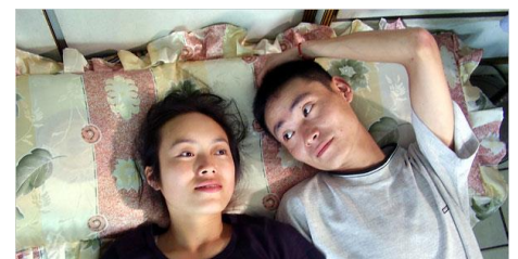
The Other half , Ying Liang, 2006

Film précédé de Condolences de Ying Liang