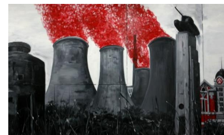
Coal spell , Sun Xun, 2008

Film suivi de Shock of Time de Sun Xun et de Single Man de Hao Jie