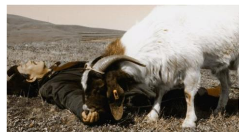
Two Great Sheep , Liu Hao, 2004