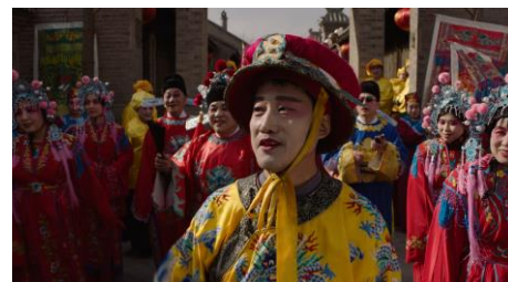
The Hedonists , Jia Zhangke, 2016