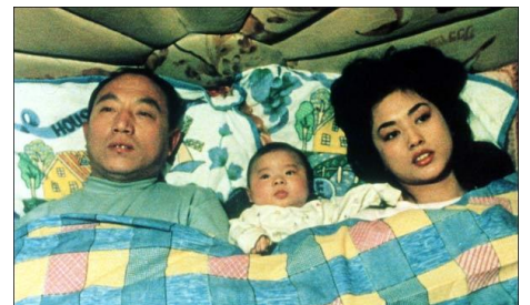
L'Orphelin d'Anyang , Wang Chao, 2001