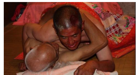
Single Man , Hao Jie, 2010

Film précédé de Coal Spell de Sun Xun et de Shock of Time de Sun Xun