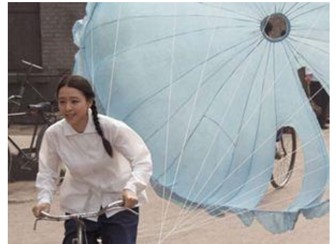
Paon , Gu Changwei, 2004