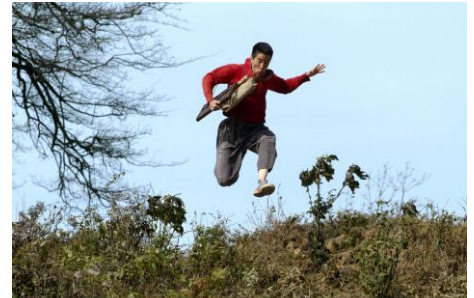
Le Soleil se lève aussi , Jiang Wen, 2007