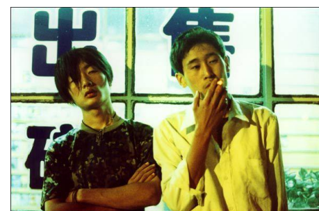
Plaisirs inconnus , Jia Zhangke, 2002

Film précédé de In Public de Jia Zhangke