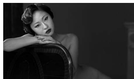
New Women , Yang Fudong, 2013 © Yang Fudong. Courtoisie de Yang Fudong et Marian Goodman Gallery.