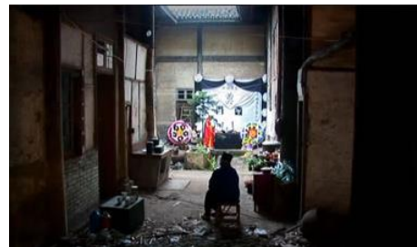
Condolences , Ying Liang, 2009

Film suivi de The Other Half de Ying Liang