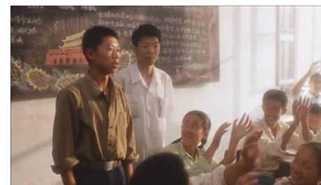
Des jours éblouissants , Jiang Wen, 1994