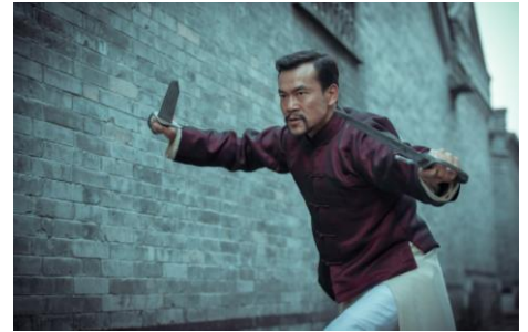
Master (The) , Xu Haofeng, 2015