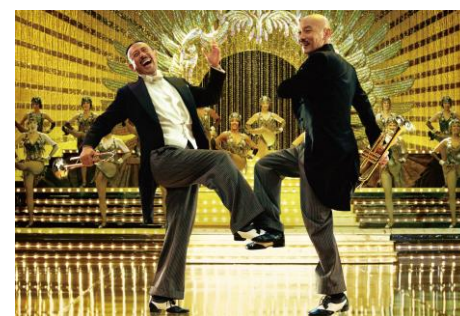
Gone with the bullets , Jiang Wen, 2014