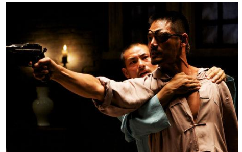
Let the bullets fly , Jiang Wen, 2010