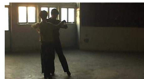
In Public , Jia Zhangke, 2001

Film suivi de Plaisirs inconnus de Jia Zhangke