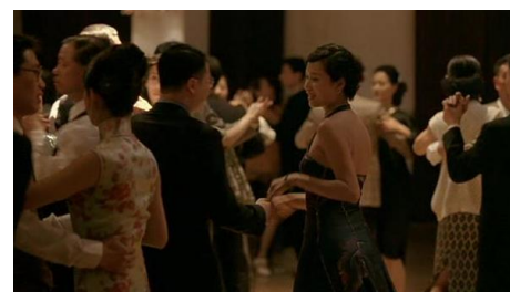
Letter from an unknown woman , Xu Jinglei, 2004