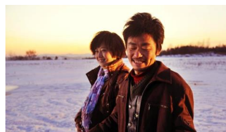
Mr Tree , Han Jie, 2011

Film précédé de [The Hedonists] de Jia Zhangke