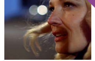
Minnie et Moskowitz