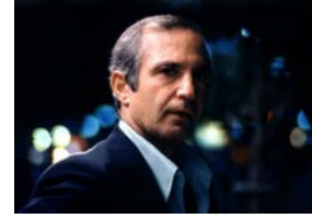
Meurtre d'un bookmaker chinois