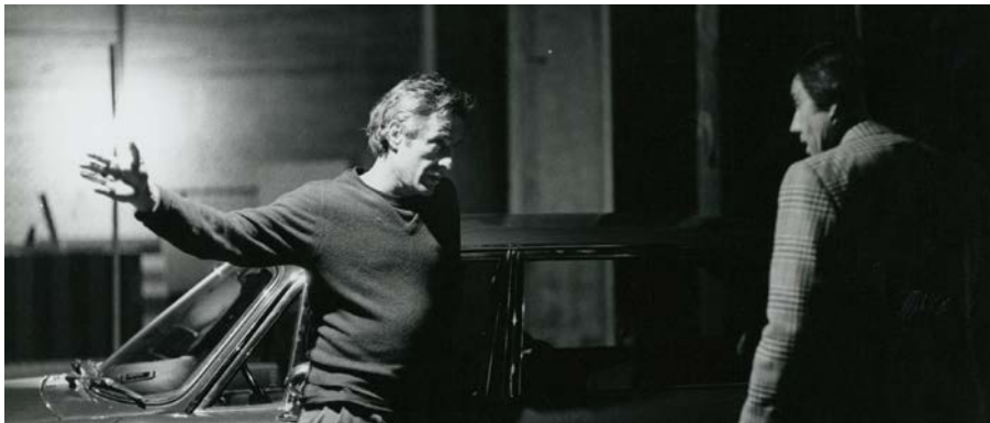
John Cassavetes sur le tournage de Meurtre d'un bookmaker chinois