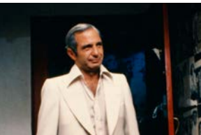
Meurtre d'un bookmaker chinois