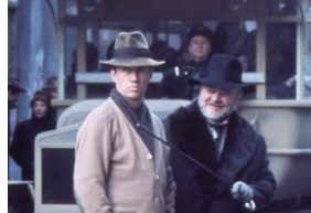
L'Œuf du serpent