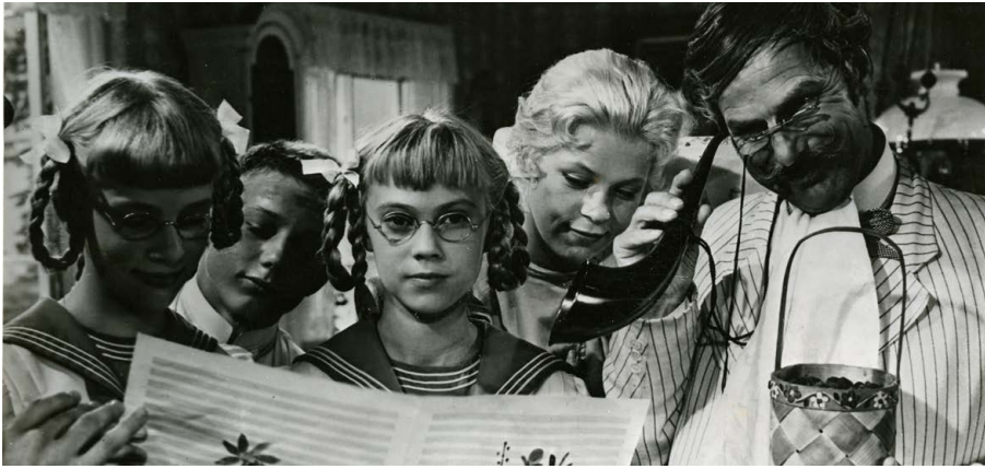
Les Fraises sauvages