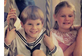
Fanny et Alexandre