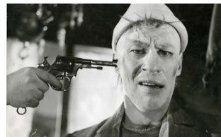
La Nuit des forains

La version intégrale de ce texte est disponible sur le site de la Cinémathèque et publiée dans le catalogue du Festival de La Rochelle (29 juin-8 juillet 2018).