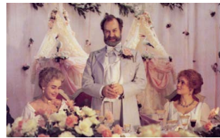
Fanny et Alexandre