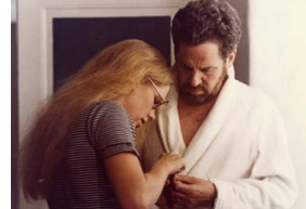
Scènes de la vie conjugale