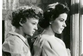
L'attente des femmes

DE INGMAR BERGMAN SUÈDE/1976/136'/VOSTF/35MM AVEC LIV ULLMANN, ERLAND JOSEPHSON, GUNNAR BJÖRNSTRAND. Une psychiatre apparemment comblée passe ses vacances sans son mari et sa fille, mais une tentative de viol la plonge bientôt dans la dépression. sa 13 oct 21h00 GF me 07 nov 19h00 GF