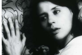
À travers le miroir