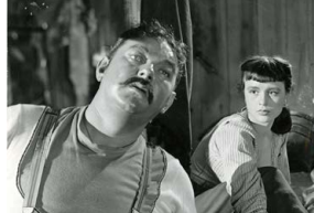
La Nuit des forains