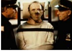
Le Silence des agneaux