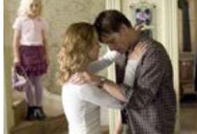
A History of Violence