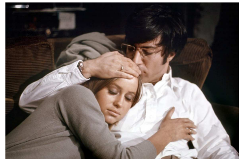
Chiens de paille (1971)