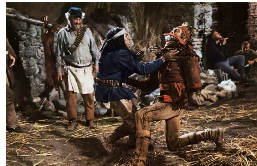
Major Dundee (1965)