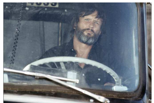
Le Convoi (1978)