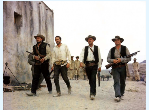
La Horde Sauvage (1969)