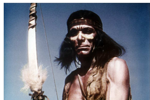
New Mexico (1961)