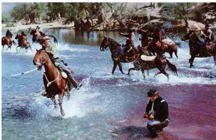
Major Dundee (1965)

Sam Peckinpah est un des plus importants cinéastes américains modernes, une incarnation de la transition entre deux ères du cinéma hollywoodien. Venu de la télévision, il réussit à renouveler le western avec des films comme Coups de feu dans la sierra , La Horde sauvage et Pat Garrett et Billy le Kid . Il se distingue par son traitement de la violence, sa vision pessimiste des relations entre hommes et femmes, son goût pour le chaos couplé à une conscience de l'Histoire de Hollywood et des États-Unis.