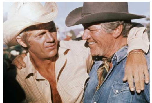
Junior Bonner, le dernier bagarreur (1972)