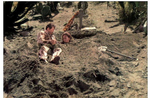
Apportez moi la tête d'Alfredo Garcia (1974)