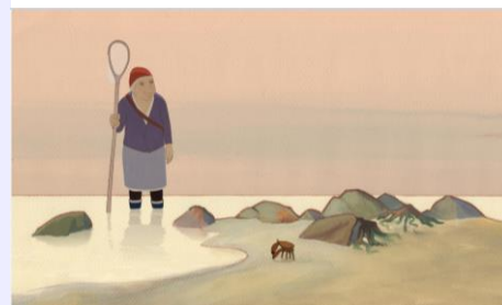
Louise en hiver, Jean-François Laguionie, 2015

lu 14 nov 20h00 – Sortie salles 23 novembre 2016