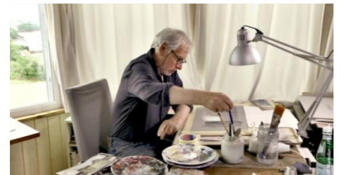
Jean-François Laguionie : Le rêveur éveillé, Jean-Paul Mathelier, 2015 © DR

La rétrospective Jean-François Laguionie se poursuit au Studio des Ursulines (10 rue des Ursulines Paris 5e) à partir du 23 novembre. Pour plus d'informations: www.studiodesursulines.com