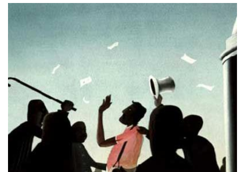
Une Bombe par hasard , Jean-François Laguionie, 1969