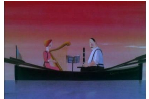
La Traversée de l'Atlantique à la rame, Jean-François Laguionie, 1978