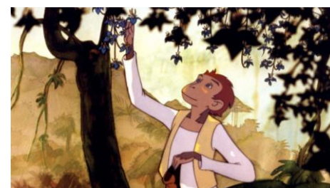
Le Château des singes, Jean-François Laguionie, 1998

Séance suivie d'une discussion avec Jean-François Laguionie.