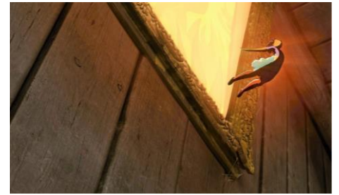
Le Tableau , Jean-François Laguionie, 2010

Séance suivie d'une signature à la Librairie