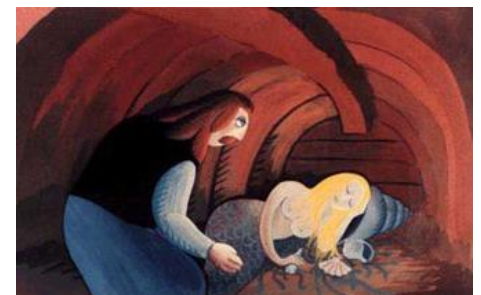
Potr' et la fille des eaux , Jean-François Laguionie, 1974