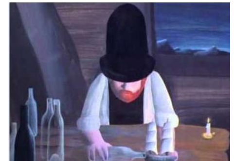
L'Arche de Noé , Jean-François Laguionie, 1967