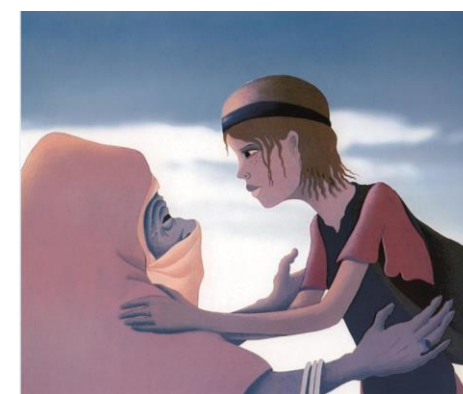
Gwen, le livre de sable, Jean-François Laguionie, 1984

Séance suivie d'une discussion avec Jean-François Laguionie.