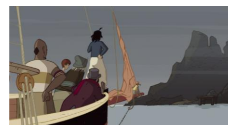
L'Île de Black Mór, Jean-François Laguionie, 2003 © Gébéka Films

Séance suivie d'une discussion avec Jean-François Laguionie.