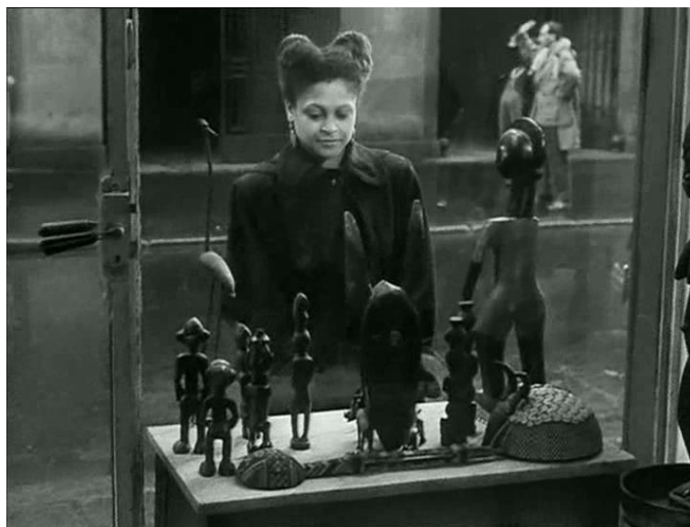
Les statues meurent aussi de Chris Marker et Alain Resnais, 1953.