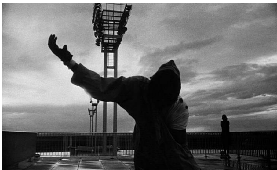
La Jetée de Chris Marker, 1962.