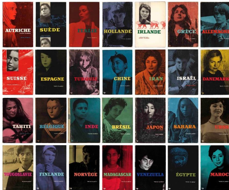
La collection Petite Planète aux éditions du Seuil, circa années 50 et 60.