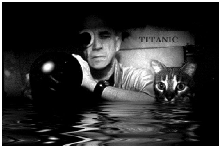
Chris Marker. Autoportrait au chat.