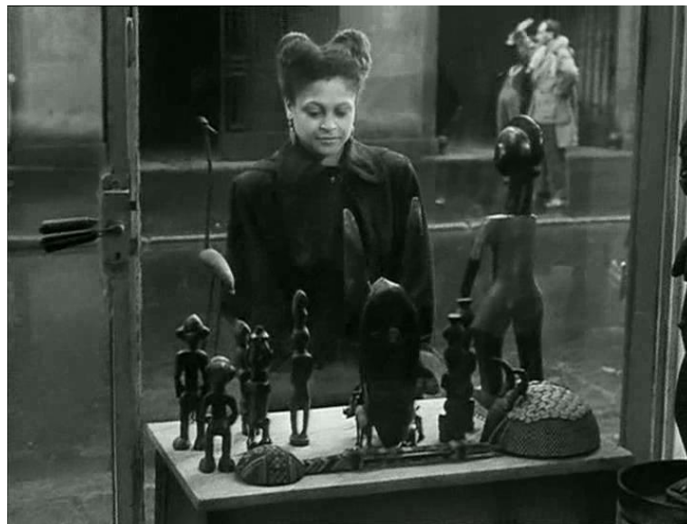
Les statues meurent aussi de Chris Marker et Alain Resnais, 1953.