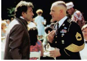
Jardins de pierre