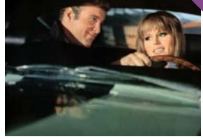
Ligne rouge 7000