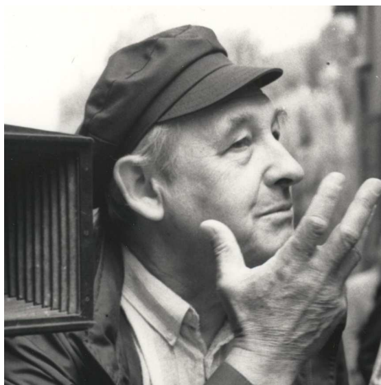
Andrzej Wajda sur le tournage de son film Chronique des événements amoureux (1986)